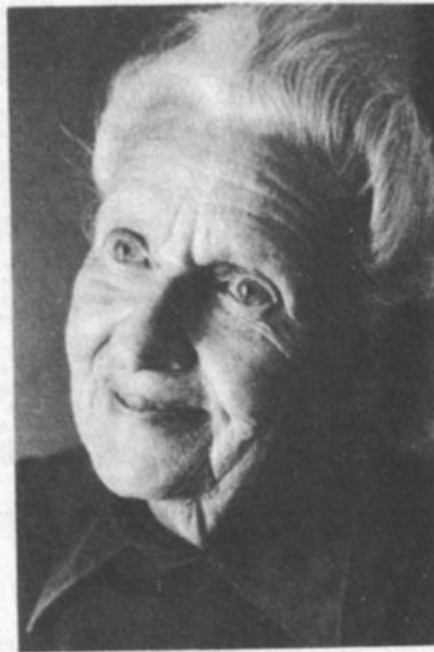
PEACE PILGRIM

Her pilgrimage is being chronicled by Swarthmore College.