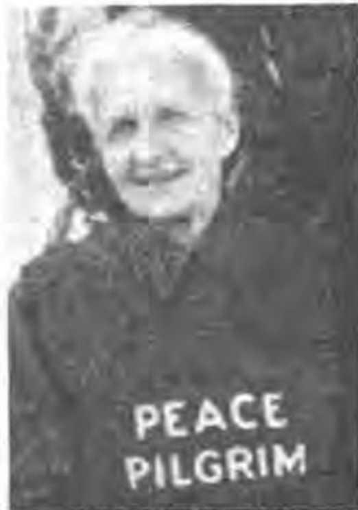
MODERN-DAY PILGRIM She has a mission

Equipped only with a toothbrush, comb and the clothes on her back, this Mystery Lady, who calls herself "the Peace Pilgrim," has traveled 30,000 miles (25,000 of them on foot) across the U.S. and Canada since 1953 on a private mission for peace. She told FAMILY WEEKLY: "I gave up home, possessions, age and name in 1953 because I found them meaningless. I had inner peace—that was all I needed to survive. At the time I felt like a voice crying out in the wilderness, but now I'm definitely on the popular side because most Americans have overwhelmingly accepted the idea of peace. But world developments have not changed my pilgrimage, Peace is much more than the temporary absence of war; it is the absence of the causes of war. I believe it will take another 10 years for an outer peace to develop and sustain itself, but even after that time I will continue to talk about the inner peace man needs to maintain outer peace." She says her pilgrimage is not supported by any group.