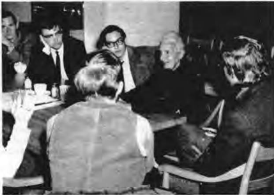
INFORMAL CONVERSATION followed Peace Pilgrim's talk at St. John's College. Surrounded by students at dining hall table, she responded to their questions on the problems of war and peace and her pilgrimage.

Why is there war? "The real problem is immaturity. With real maturity war would be impossible. It would never be considered as a solution of problems between men."