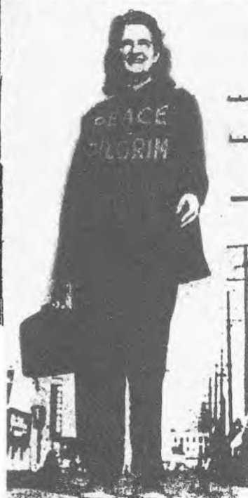
Walker WISHING to be known only as the "Peace Pilgrim," this mystery woman will leave Los Angeles today on a cross-country hiking tour to the east coast in the interests of world peace.

falsehood with truth and hatred with love. The Golden Rule, she said, would do as well.