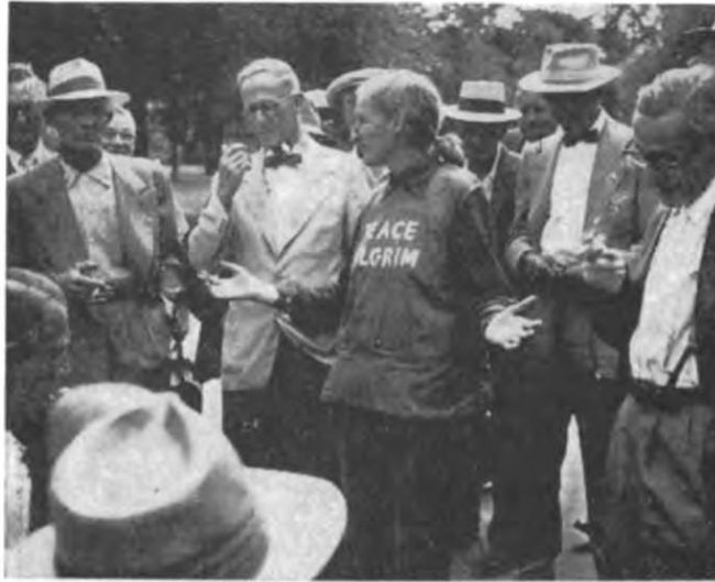
MESSAGE FOR BOSTON —Describing herself as a "peace pilgrim" but refusing to identify herself this woman talked on Boston Common yesterday and says she has walked 8900 miles in 37 states to promote world peace.